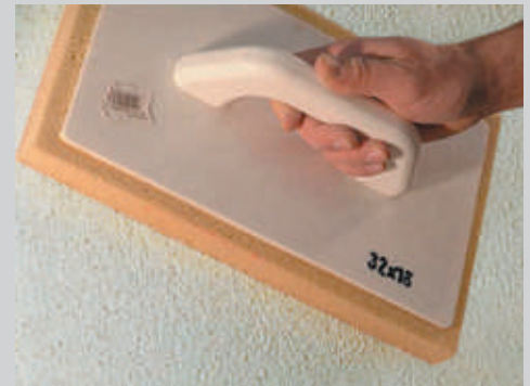
5 Fratar con esponja fina