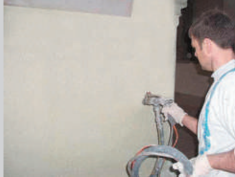
1 Aplicación proyectada