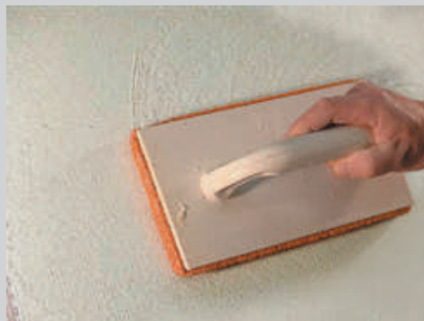
4 Fratar con esponja media