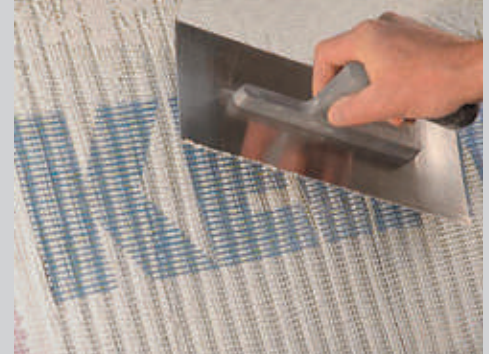
2 En su caso, incorporar malla