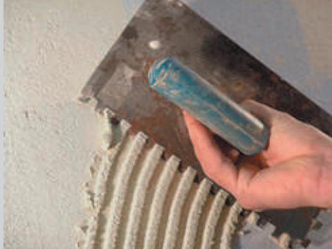
1 Aplicación manual