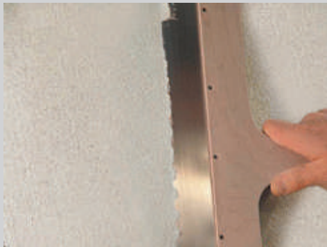
3 Nivelar y alisar