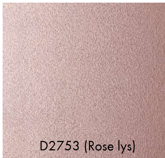
D2753 (Rose lys)