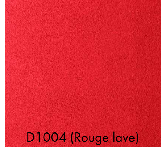
D1004 (Rouge lave)