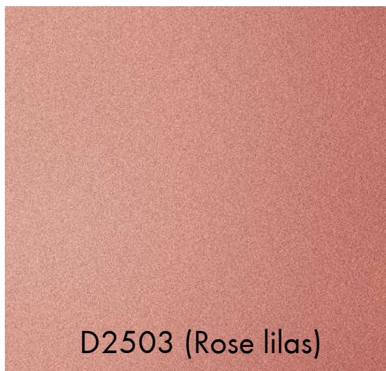
D2503 (Rose lilas)