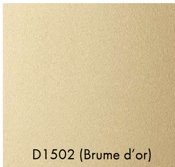
D1502 (Brume d'or)