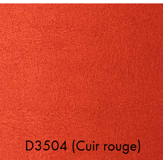
D3504 (Cuir rouge)