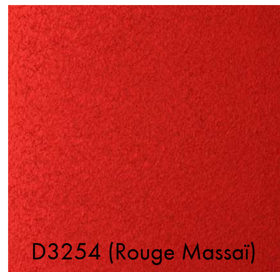
D3254 (Rouge Massai)