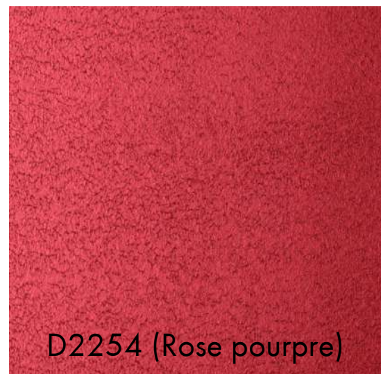
D2254 (Rose pourpre)