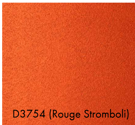
D3754 (Rouge Stromboli)