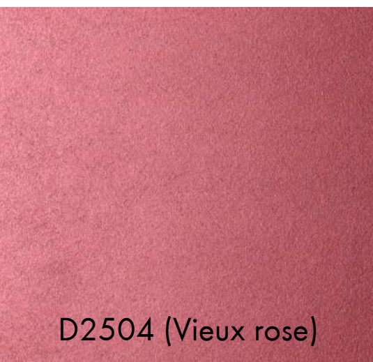
D2504 (Vieux rose)