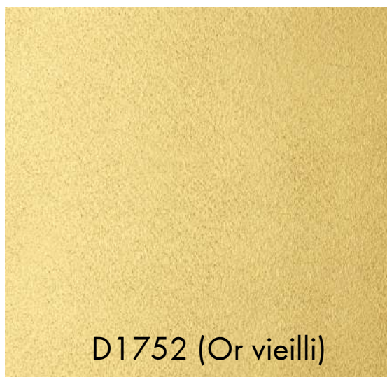
D1752 (Or vieilli)