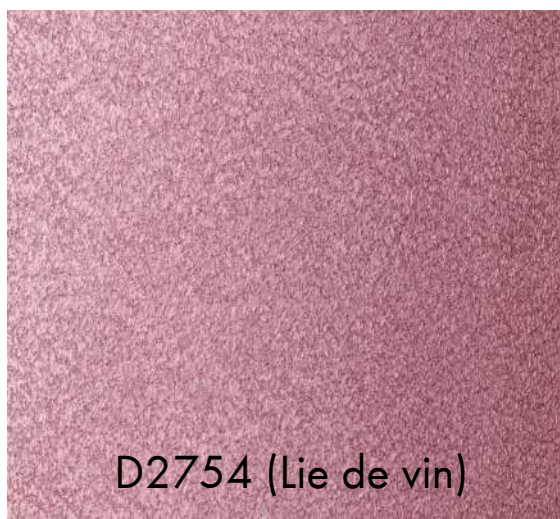
D2754 (Lie de vin)