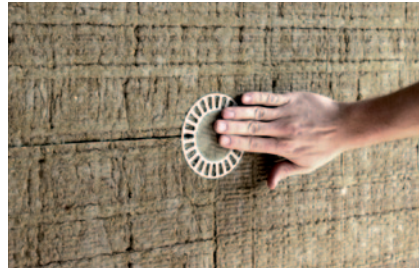
Dübelteller VT 2G

9.3. Oberflächenbündige Verdübelung Die oberflächenbündige Dübelmontage ist die einfachste und rationellste Verdübelungsart. Bei bestimmten Dämmplatten müssen die Dübelteller durch das Aufsetzen von Zusatztellern vergrößert werden.