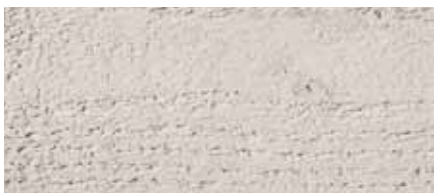
Farbton Nr. 4875