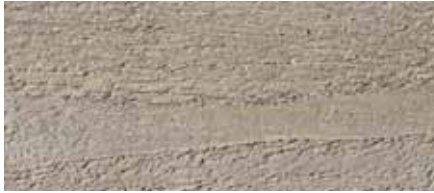
Farbton Nr. 4470