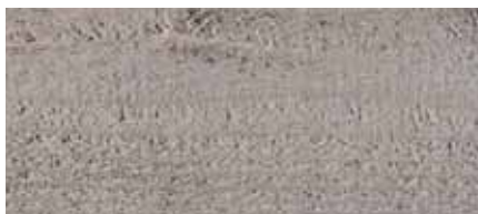
Farbton Nr. 4880