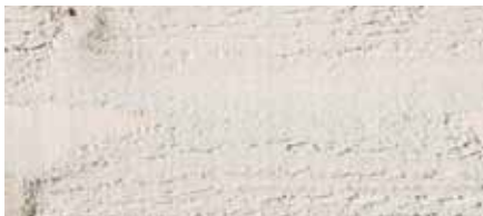
Farbton Nr. 4861