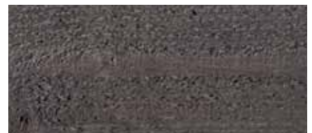
Farbton Nr. 4890