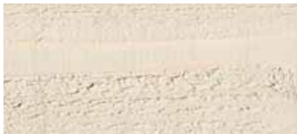
Farbton Nr. 4863