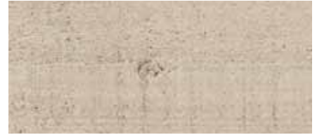
Farbton Nr. 4832