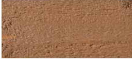
Farbton Nr. 4735