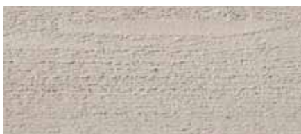
Farbton Nr. 4259-M