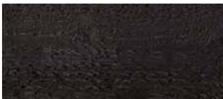
Farbton Nr. 4895