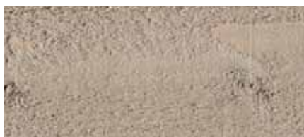
Farbton Nr. 4470-M