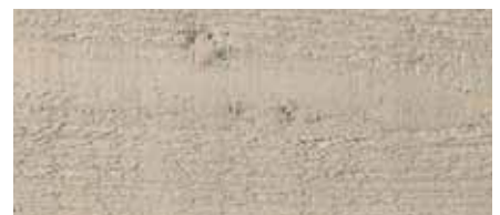
Farbton Nr. 4832-M