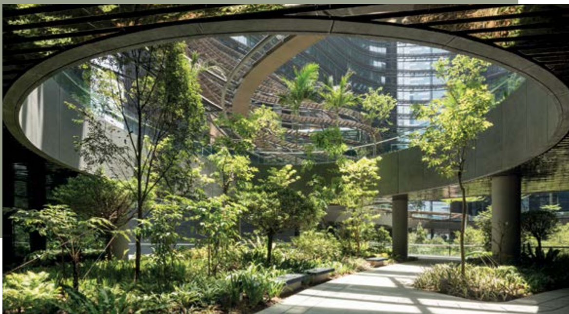
Marina One Singapur, KEIM Concretal-Lasur; Foto esquerda: Alnatura Campus Darmstadt, KEIM Lignosil-Inco

A KEIM sempre foi pioneira na sustentabilidade e, com a certificação de 65 produtos em 4 categorias de produtos, está na vanguarda do sector da construção. Isto representa mais de 80% das vendas de tintas da KEIM. Todos os produtos têm a certificação Cradle to Cradle® de nível prata. Os produtos e processos foram avaliados nas 5 categorias seguintes como parte da certificação.