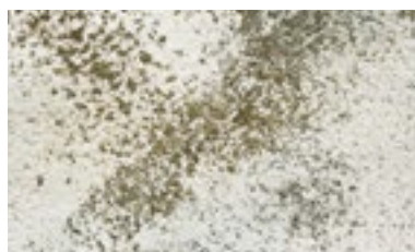
Pintura orgânica deteriorada

Contém fibras e cargas minerais selecionadas de granulometria máxima 1,0 mm; cor branco.