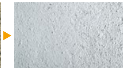
Primário de regularização da superfície KEIM Contact-Plus-Grob