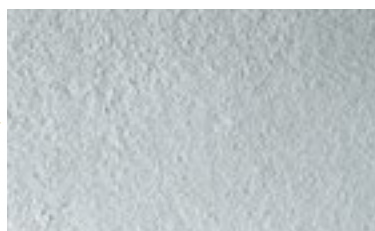
Primário de regularização da superfície com função de primário promotor de aderência KEIM Contact-Plus