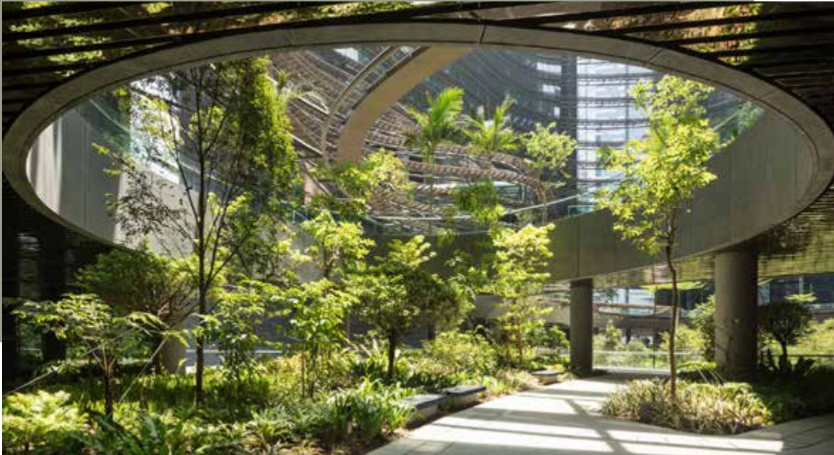
Marina One Singapur, KEIM Concretal-Lasur; Foto izquierda: Alnatura Campus Darmstadt, KEIM Lignosil-Inco

KEIM siempre ha sido pionera en materia de sostenibilidad y, con la certificación de 65 productos de 4 grupos de productos, se ha situado a la vanguardia de la industria de la construcción. Esto supone más del 80% de las ventas de pintura de KEIM. Todos los productos reciben la certificación Cradle to Cradle Certified® de nivel plata. Los productos y procesos fueron evaluados en las siguientes 5 categorías como parte de la certificación.