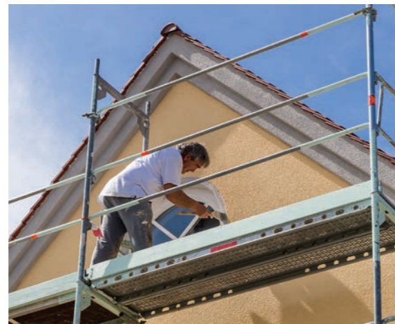
Effektiv und praktisch, wenn man das Material, das auf den Baustellen immer und immer wieder benötigt wird, jederzeit griffbereit hat!

Reduzieren Sie Materialvielfalt und Komplexität und setzen Sie auf die Sprinter-Produkte von KEIMFARBEN. Eine Entscheidung für Sicherheit, schnelle Verfügbarkeit und hohe Wirtschaftlichkeit. Mit den Sprinter-Produkten im Laderaum sind Sie für Ihre Baustellen perfekt gerüstet und bewältigen viele Projekte in kürzester Zeit. Lernen Sie die Sprinter-Produkte kennen und erleben Sie echte Partnerschaft im Handwerk mit KEIM.