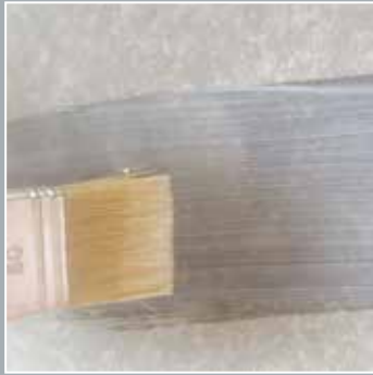
1. Auftrag von Aravel mit Pinsel, Roller oder Airless