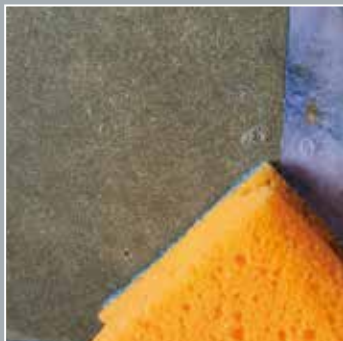
7. Nachreinigung mit Seifenwasser oder Wasserdruck (Farbschlamm nach behördlicher Vorschrift entsorgen)