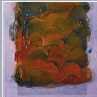
5. Nach 3 bis 5 Minuten: aufgequollene Aravel-Sprayschicht