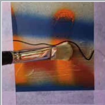
4. Auftrag des Aravel-Removers bzw. des KEIM Dispersionsentferners