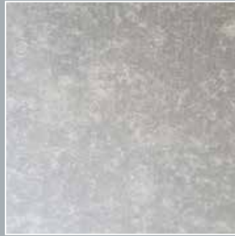
2. Auftrocknendes Aravel