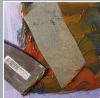
6. Abstossen des aufgequollenen Films