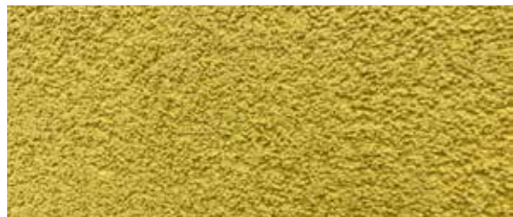
Die natürliche Optik des Kratzputzcharakters von KEIM Stucasol