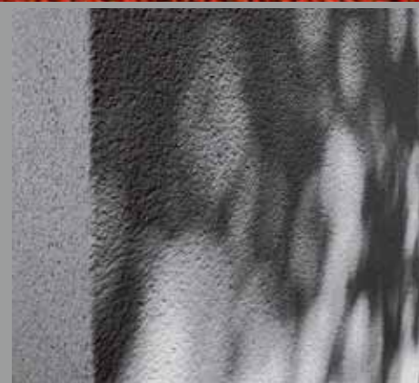
Perfekte Optik – auch ohne Anstrich

Stucasol enthält ausschließlich anorganische, absolut lichtbeständige Farbpigmente. Das Sol-Silikat-Bindemittel schafft eine enorm beständige und homogene Einbindung der Pigmente in der Putzmatrix.