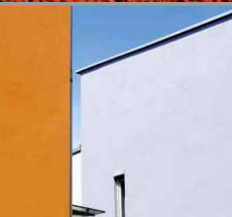
Super Verarbeitung – super Oberfläche