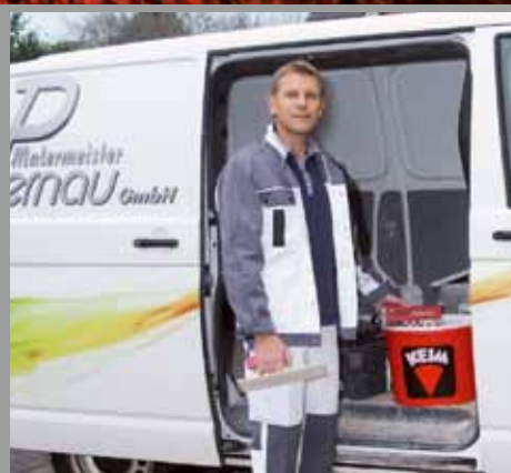
Meine Meinung: klare Empfehlung!