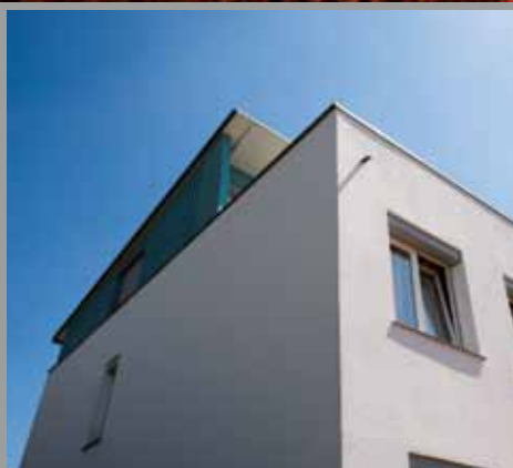
Sol-Silikatputz – Siliconharz war gestern

Die Erfolgsgeschichte von KEIM Soldalit hält Einzug in die Welt der pastösen Putze.