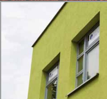
Absolut farbtinstabil – Typisch KEIM

Der erste Sol-Silikatputz im Markt verbindet die überzeugenden bauphysikalischen Eigenschaften silikatischer Baustoffe mit den Vorteilen des Sol-Silikats als Bindemittel. Einfache, sichere Verarbeitung, homogene Oberflächen, universelle Anwendung. Dazu hoher Wetterschutz und Nichtbrennbarkeit. Besser geht's nicht!