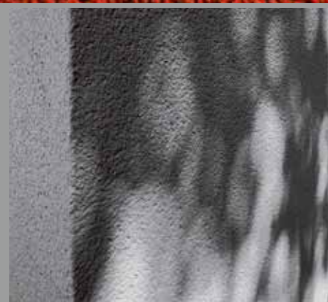
Resa perfetta – anche senza dipingere

KEIM Stucasol® contiene solamente pigmenti inorganici estremamente resistenti alla luce e ai raggi solari. E questi stessi pigmenti sono stabili ed omogeneamente incorporati nella trama del rivestimento grazie al legante a base di silicato.