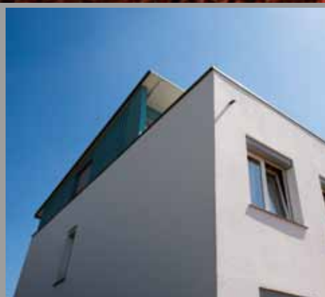
Intonachino al sol di silicato – la resina siliconica è il passato

+ + + KEIM Stucasol® – il primo intonachino al mondo in cui il lega