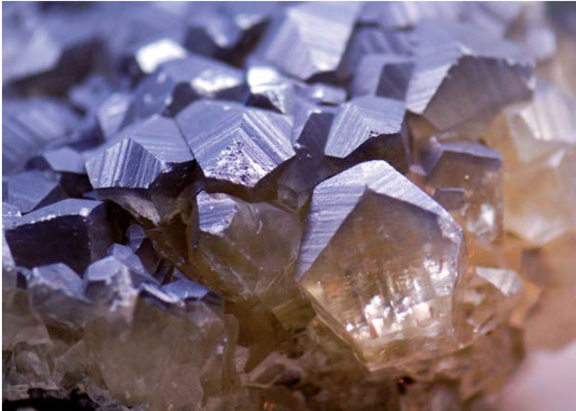
Quarz – der Grundstoff für das silikatische Bindemittel „Wasserglas“ oder „Kaliumsilikat“