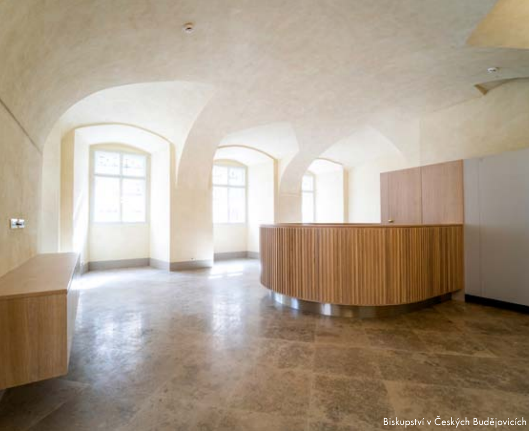
Biskupství v Českých Budějovicích