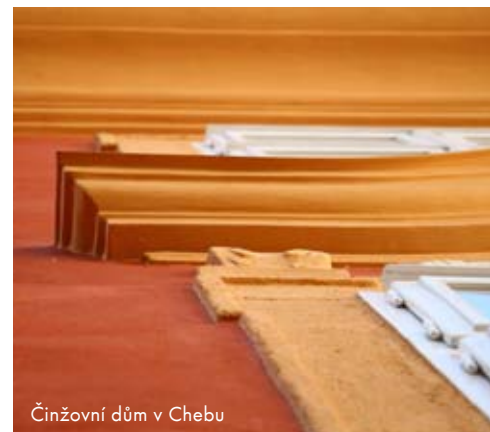
Činžovní dům v Chebu