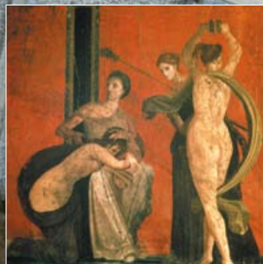
Freska Tančící bakchantka. Vila mystérií, Pompeje, kolem r. 60 n.l. (výrez)